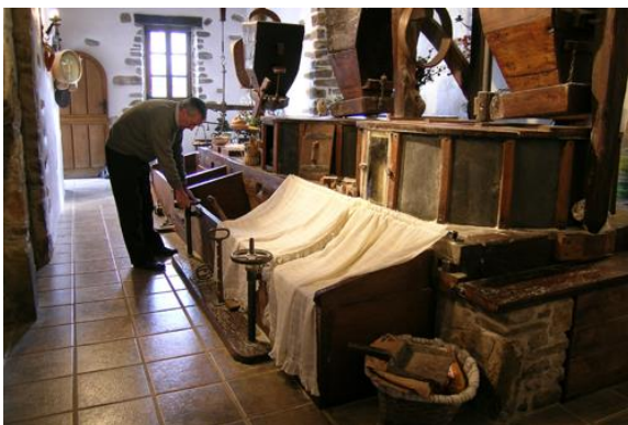
Olabarriko errotaren barrualdea