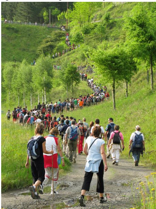
Parte-hartzaileak Undurragako urtegiaren presara bidean

izango dira eta nahi dutenek kuku bat egin eta errota lanean ikusteko aukera izango dute. Ibargutxitik Lanbreabeko errotera, eta hemendik berriro Undurragako urtegiaren ertzetik ekingo diote —oraingoan beste aldetik—; urtegiaren presatik 100 metro aitzina, Alkiberren, indarrak berritzeko jan-edana banatuko da. Aurrerantzean, lehenengo Otzerinmendi auzunean eta gero Uriben sartuko dira ibiltariak, eta Intxaurbeko, Axpeko eta Zulaibargo erroten ondotik igaro ostean, azken kilometroa betetzen hasiko dira; helmuga baino 300 bat metro lehenago ibilbideko azken errota azalduko da, Olabarrikoak —Pujana familiak erabat zaharberritua—, eta sartu-irtena egiteko aukera izango da, Zeanuriko plazara iritsi eta ibilaldiari amaiera eman aurretik.