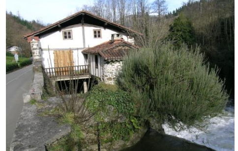
Molino de Errotabarri

En Errotabarri hay un calce que arranca en la estolda (desagüe) y se prolonga unos 80 metros en paralelo al río, hasta compensar el desnivel de la vía madre . Su actividad cesó en abril de 1975. El último molinero fue Andrés Aldekoa Ane .