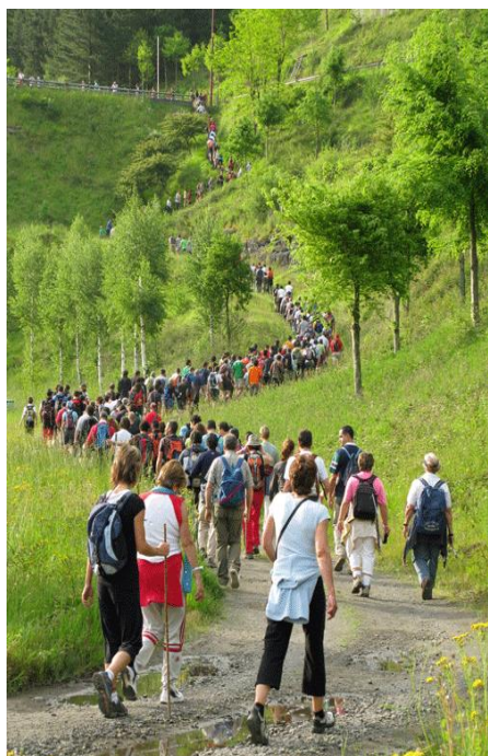
Participantes, dirigiéndose hacia la presa del embalse de Undurruga