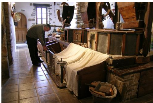
Interior del molino de Olabarri

río Arratia. Originariamente fue ferrería, y así aparece mencionado en la documentación del S. XVI.