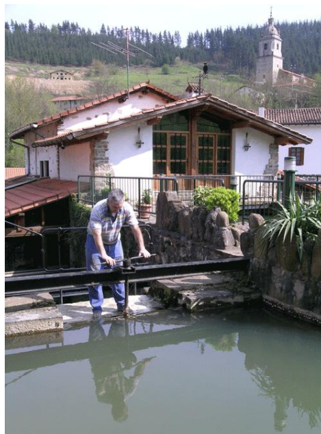
Trabajando en la antepara del molino de Olabarri

oportunidad de acceder a su interior para contemplarlo en funcionamiento. Desde Ibargutxi se continúa para volver hacia el embalse de Undurruga pero, en esta ocasión, bordeándolo por la margen opuesta. Frente a la presa del embalse se sitúa el punto de avituallamiento. Tras reponer fuerzas, los caminantes se adentran primero en la barriada de Otzerinmendi y después en la de Uribe, donde pasan junto a los molinos de Intxaurre, Axpe y Zulaibar, y ya en el último kilómetro del recorrido, se encuentran con el molino de Olabarri , que está totalmente rehabilitado; se puede acceder al interior para contemplar las diferentes dependencias y, finalmente, enfilarse los últimos 300 metros que restan hasta la meta situada en la plaza de Zeanuri.