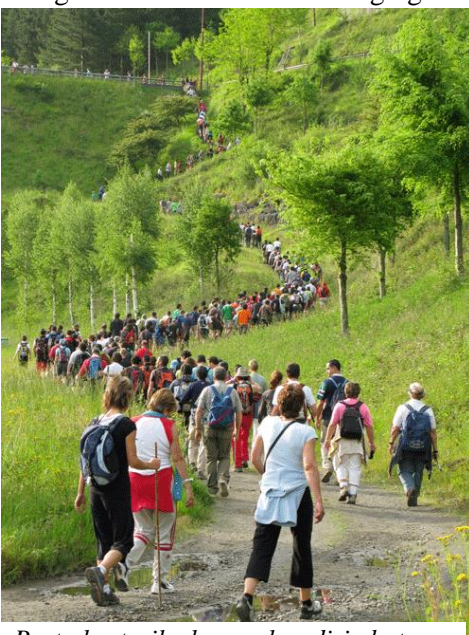
Parte-hartzaileak aurreko edizio batean

Ibargutxiko errotarako bidea hartuko dute; hemen ere, atea zabalik izango dira eta nahi dutenek kuku bat egin eta errota lanean ikusteko aukera izango dute. Ibargutxitik berriro Undurragako urtegiaren ertzetik ekingo diote —oraingoan beste aldetik—; urtegiaren presatik 100 metro aitzina, Alkiberren, indarrak berritzeko jan-edana banatuko da.