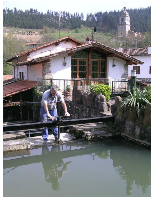
Olabarriko anteparan lanean

Irteera herriko plazan izango da, goizeko 09:00etan; udaletxearen aurretik abiatuz lehenengo Altzibergo erroten ondotik igaroko dira ibiltariak eta 500 metro aurrerago Errotabarrin iritsiko dira: hemen sartu-irtena egiteko eta errota martxan ikusteko aukera izango dute. Jarraian Undurragako urtegiaren ertzetik aurrera egingo dute. Urtegia atzean utzi eta